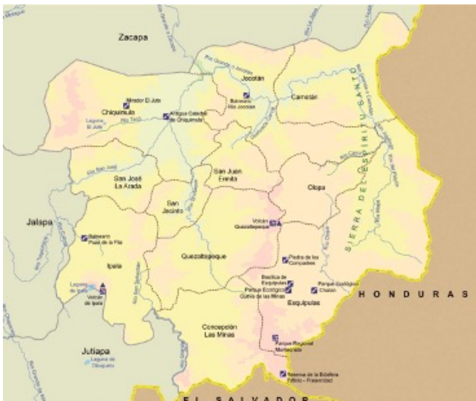
Mapa Departament de Chiquimula.

El poble maia Ch'orti ' històricament estava assentat al sud-est de Guatemala (al departament de Chiquimula i Zacapa ), al nord-est d'Hondures ( Copan i Ocotepeque ) i al nord d'El Salvador. Es tracta d'un territori ancestral dividit políticament i econòmicament per tres estats-nació. A Guatemala, concretament al Departament de Chiquimula , és on viu la major part d'aquest poble; unes cent mil persones Ch'orti' segons l'últim cens de població realitzat per l'Institut Nacional d'Estadística guatemalenc a l'any 2018. No obstant, les organitzacions indígenes apunten que el cens de 2018 no reflecteixi la diversa realitat del país donat que no es van realitzar campanyes suficients per a promoure l' auto identificació i per altra banda, al fet que en diverses comunitats no es va poder realitzar la identificació de totes les persones que hi vivien.